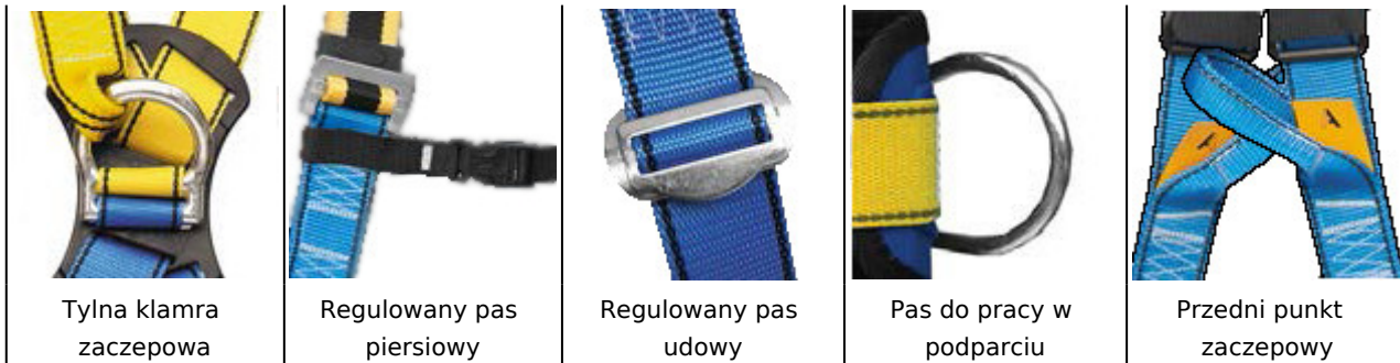
Tylna klamra zaczepowa